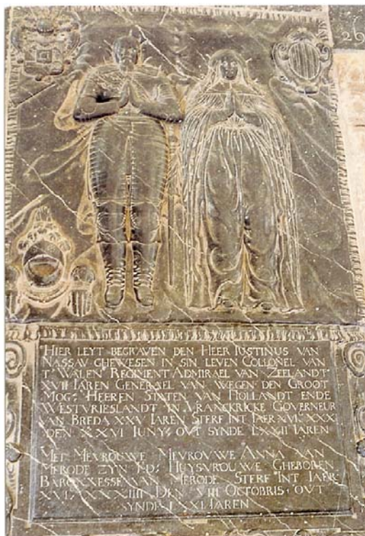
Afbeelding 1: Grafsteen van Justinus van Nassau en Anne van Merode (1565-1654), Hooglandse Kerk, Leiden.

Deze even zo extensieve als excentrieke wooncultuur kan bogen op een lange kasteeltraditie. Immers de bezitters van het kasteel waren zelden van Astense komaf en wendden steevast de blik ver voorbij de zompige moerassen van de Peel. Natuurlijk waren er de pachters van de voorburcht die al generaties lang dezelfde kasteelgrond bewerkten, maar de eigenlijke heren en vrouwen van het kasteel kwamen vrijwel altijd uit een onbekend Verweghistan en trokken als "beschaafde" globetrotters langs al hun andere onroerende goederen in den lande. Hieraan ontleenden zij ook dat voor de dorpsbewoners zo exotische aura dat Coolen zo treffend beschrijft in zijn De vrouw met de zes slapers .